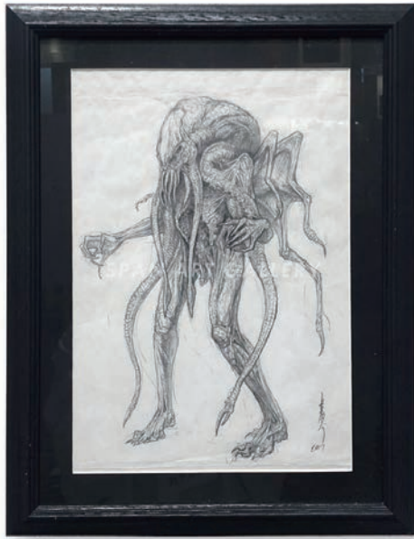
《Call of Cthulhu (デザイン画)》